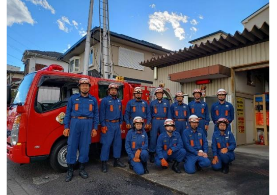
消防団年末火災特別警備督励