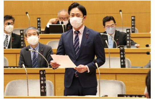
今定例会での一般質問

また、文部科学省が必 要な換気量を確保するの に有効とし、積極的な導 入の検討を求めている全 熱交換器(換気の際に室 内の暖気を再利用できる 換気システム)が整備さ れていたにも関わらず活 用されていないことが判 明し、環境・省エネの観 点からも活用するよう求 めました。 さらに、補完的な役割 を担い、不安の軽減や意 欲の向上に効果が期待さ れるHEPAフィルタ付 空気清浄機を全ての一般 教室に設置するよう要望 しました。今後も子ども たちの学びと教育機会の 保証に向けて努めてまい ります。