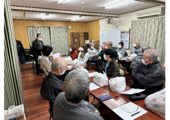
町内会等あいさつまわり